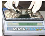
Alle Tiere auf die Waage im Londoner Zoo