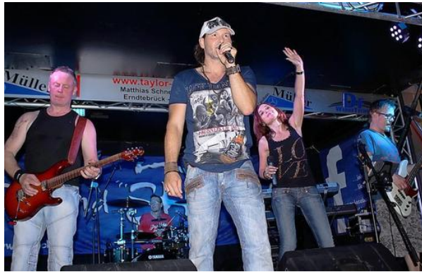
Die Sauerländer Coverband „Second Hand“ heizte ihrem Publikum auf dem Hof der Laasphe Brauerei Bosch mächtig ein.

Am Freitag ist Pause im Programm, in der kommenden Woche wird die Konzertreihe auf dem Brauereihof mit dem Auftritt der heimischen Band "Silent Seven" fortgesetzt.