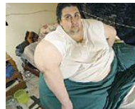
Ehemals dickster Mann der Welt ist tot