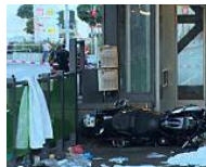
Motorradfahrer in Berlin-Neukölln tödlich verunglückt